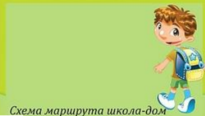
Схема маршрута школа-дом