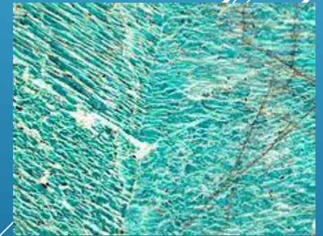
Амазонит ( микроклин ) с пертитами (вростки) альбита. Кольский полуостров, Россия