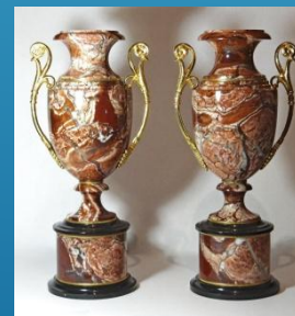
Вазы из яшмы