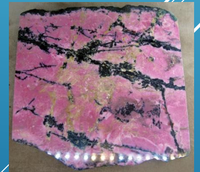
Уральский родонит - орлец