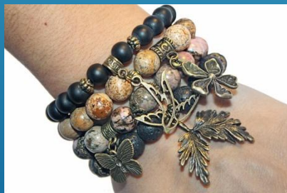
Браслет из яшмы