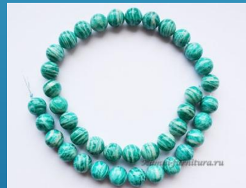
Браслет из амазонита