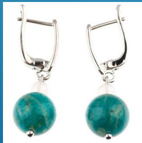
Серьги с амазонитом