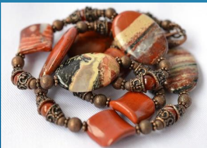
Бусы из яшмы