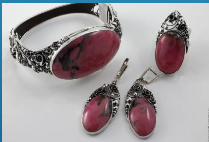
Серебряные кулон, серьги и кольцо с родонитом