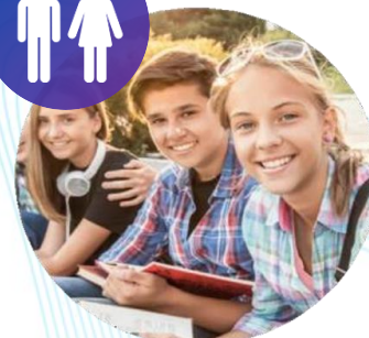
ПЕРВИЧНЫЕ ОТДЕЛЕНИЯ РДМ