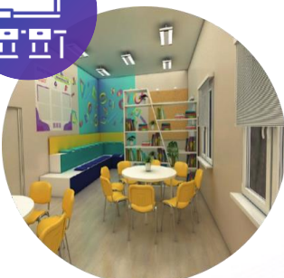
ЦЕНТРЫ ДЕТСКИХ ИНИЦИАТИВ