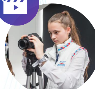
МЕДИА ЦЕНТРЫ КИНОКЛУБЫ