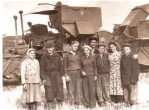
Рабочие совхоза Южаковский, начало 1960-х гг.

В 1962 году было построено деревянное здание больницы со стационаром и поликлиникой (кабинеты зубного врача, физкабинет, процедурный, детский, терапевтический, гинекологический). Медки осваивали и смежные специальности ла-