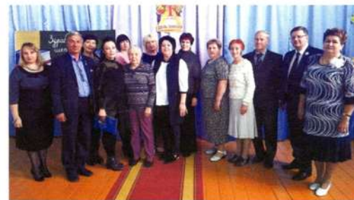
Коллектив школы п. Синегорский. 2019 г.

На территории поселка Синегорский с 2006 года работает пункт общей врачебной практики. Медицинский персонал ОВП обслуживает жителей поселков Синегорский, Северка, Дальний и Зональный. Работой медицин-