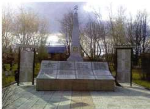
Обелиск воинам, погибшим в годы Великой Отечественной войны, с. Южаково