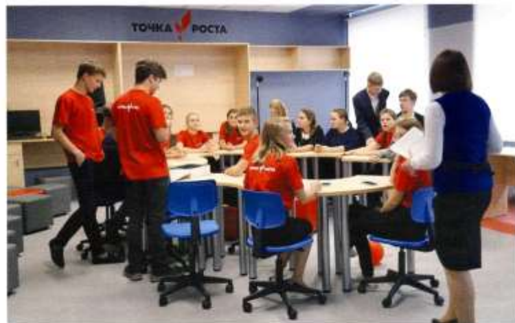
Центр образования цифрового и гуманитарного профилей «Точка роста»

и сетевого партнерства. Центр также является общественным пространством развития общекультурных компетенций, цифровой грамотности, шахматного образования, проектной деятельности, творческой, социальной самореализации детей, педагогов, родительской общности. Совокупность образовательных организаций, на базе которых создаются Центры, составят федеральную сеть Центров образования цифрового и гуманитарного профилей «Точка роста».