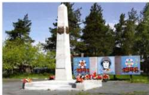
Обелиск в память, погибшим в годы Великой Отечественной войны, в. Новосибест