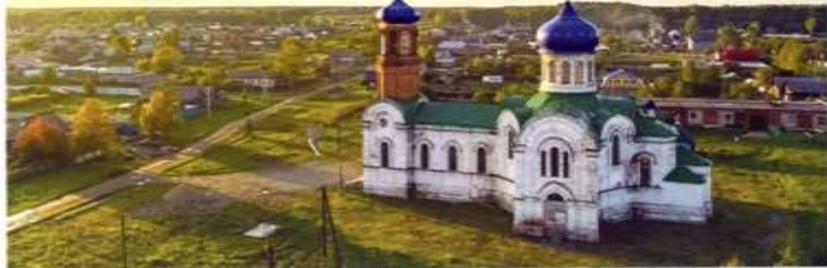
Любовь к Родине начинается с любви к своему дому, к своей улице, к своим родителям и к своему родному селу.

В 2015 г. при въезде установлена стела с эмблемой поселка. В том же году состоялось открытие памятника, посвященного ветеранам, воевавшим в годы Великой Отечественной войны, призванным из деревень Хутор, Каменка, п. Молодежный.