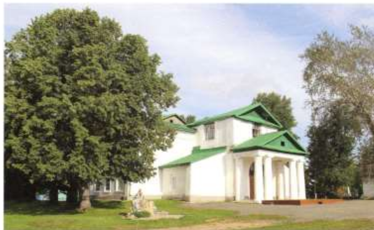
Минералогический музей имени А. Е. Ферми в селе Мурзинка

Нескончаемый поток машин прибывает в село Мурзинка в августе на фестиваль Камни «Самоцветная полоса». В этом году здесь отмечали еще одну знаменательную дату – 55-летие со дня открытия минералогического музея имени А. Е. Ферсмана. Теперь не только жители Пригородного района, Нижнего Тагила но и других близлежащих городов стремятся сюда, чтобы побывать в музее, полюбоваться минералами, которые хранятся в этой благодатной земле и представляют собой уникальные залежи самоцветов.