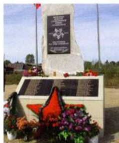
Памятник воинам, погибшим в годы Великой Отечественной войны