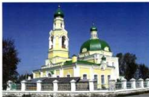
Церковь Николая Чудотворца в селе Николю-Павловское

Первый деревянный храм в деревне Павловской был построен в 1872 году, и деревня получила статус села Николю-Павловского. В селе были земское училище, церковно-приходская школа, библиотека. Облик зажиточного села придавали богатые дома купцов, которые располагались на двух центральных улицах вдоль тракта – на Тагильской