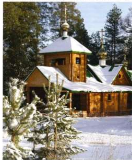
Храм во имя святых великой княгини Елисаветы и инокини Варвары