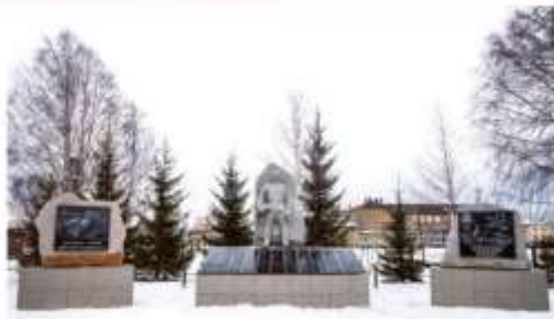
Мемориальный комплекс воинам, погибшим в годы Великой Отечественной войны и другим воинам

Жизнь диктует помнить всех поименно. В годы Великой От-