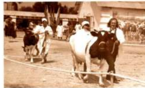
Представители племзавода «Тагил» на областной сельскохозяйственной выставке