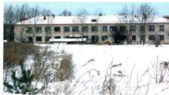
Детский комбинат в селе Нововольняцко