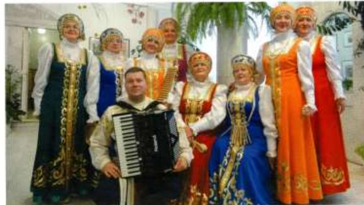
Народный ансамбль «Сударыня» из поселка Первомайский

В целях приближения к творчеству, любительскому искусству и ремеслам муниципальные учреждения деистают 236 клубных формирований (коллективы любительского художественного творчества, любительские объединения и клубы по интересам), в которых занимается