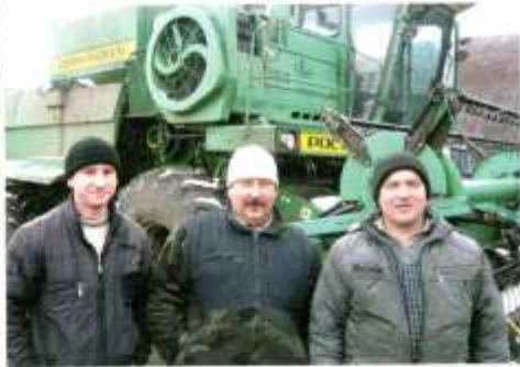
ГУП СО «Совхоз Шумихинский» – единственное государственное предприятие, которое продолжает работу на территории округа

Совхоз «Южакский» специализировался на выращивании крупного рогатого скота молочно-мясного направления. Кроме этого, совхоз специализировался на выращивании племенного молодняка крупного рогатого скота тагильской породы. В его составе было 5 отделений (Луговое, Мурзинское, Сизяковское, Южакское, Кайгородское), 11 ферм крупного рогатого скота, две свиноводческие фермы. Площадь сельскохозяйствен-