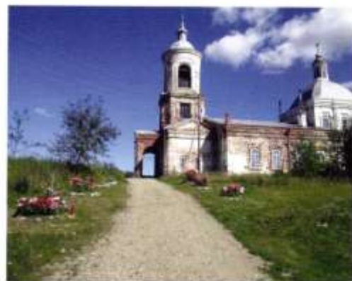
Храм Рождества Пресвятой Богородицы

Не обошла деревни старая и коллективизация. Было организовано десять колхозов, которые в дальнейшем реорганизовались в племсовхоз, а