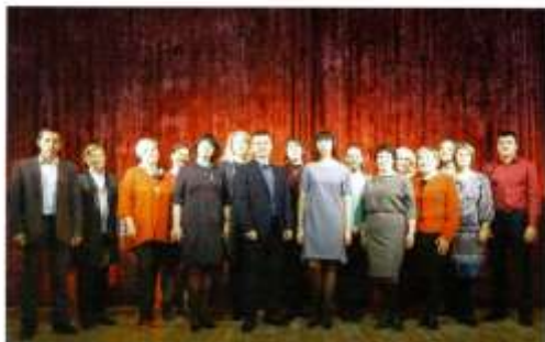
Коллектив Управлений и руководители учреждений культуры и общественной политики

Приняты постановления администрации о реорганизации в сентябре 2014 г. №2441 «О реорганизации муниципального бюджетного образовательного учреждения дополнительного образования детей «Черноосточенская детская школа искусств» путем присоединения к нему муниципального бюджетного образовательного учреждения дополнительного образования детей «Горноуральская детская школа искусств». В это же время принято постановление «О реорганизации муниципального бюджетного образовательного учреждения дополнительного образования детей «Никола-Павловская детская школа