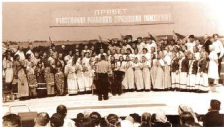
Сводный хор Петрокаменского района, 1960-е гг.