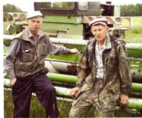
Работники Шумихинского совхоза

на угле. Теперь и она осталась в прошлом. А в 1989 году начала работать газовая котельная. С 2016 года сельчане пользуются индивидуальным газовым отоплением. В селе было построено много новых домов на улицах Новая, Полевая; двухквартирные дома в деревне Шумиха на улицах Победы и Гаражной, в деревне Матвеева. Кстати, первый двухэтажный кирпичный дом был построен в