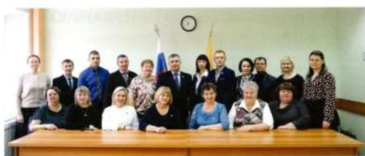
Депутаты Думы Горноуральского городского округа 2017-2022 гг.