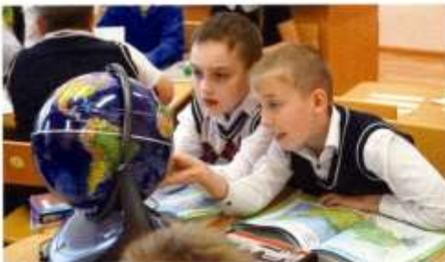
Интерактивная школа в с. Покровское

стабильным и высокоскоростным интернетом. К 2024 году в городских образовательных организациях скорость соединения должна составлять не менее 100 мегабит в секунду (Мб/с), в сельских школах – не менее 50 Мб/с. В Свердловской области данный проект начнет реализовываться уже с 2020 года, и скоростной интернет должен войти во все школы округа.