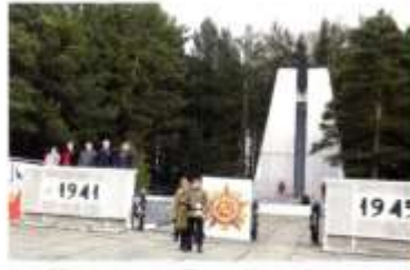
Мемориал героям Великой Отечественной войны