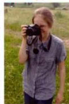
Надеемся, что студия «Евразия ТВ» принесет немало пользы в деле воспитания подрастающего поколения

Студией руководят педагоги первой категории, имеющие в портфолио грамоты победителей и лауреатов всероссийского, международного и областного уровня. В октябре 2019 года обучающиеся Дома творчества стали призерами международного конкурса видеосюжетов «Моя малая родина».