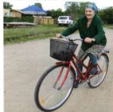
Памятку от отца Манефа Константиновна читает и следов. Сидеть на велосипеде, она вспоминает всю

Сколько слез пролито вдовами и сиротами!!! Будь проклята та война и Гитлерюк вместе с ней! Очевидец из Бубасовой сказал, что 22 декабря 1941 года папа умер от раны в живот».