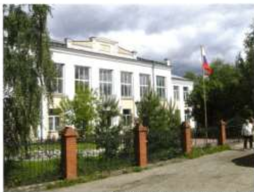
Висимская школа - одна из лучших в округе

Б удущее Висима видится в дальнейшем развитии туризма, у поселка есть для этого огромный потенциал. Большие надежды жители поселка возлагают на развитие туристического кластера «Гора Белая».