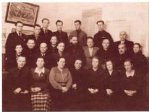
Дети в школе, 1956 г. г.

В советский период поселок Висим развивался, работали предприятия и объекты социальной сферы. В 1929 году был организован колхоз «Боевик». Первым председателем колхоза был Константин Саввич КАНОНЕРОВ. В 1927 году в Висиме был основан «Промогид», переименованный позднее в «Промкомбинат». Здесь добывали мрамор, заготавливали лес, вручную пилили его на тес. Когда построили лесопилочную раму, стали выпускать более 80 наименований продукции. В