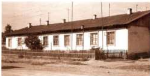
Корпус детского дома, в. Новосибест, 1940 г. г.

Руду собирали в ведро вручную. Кайло, лопата, молоток, чтобы отбивать приклевещую к камню руду, оставались главным инструментом забойщиков на