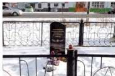
Новый въездник деревни Гражданской войны