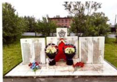
Обелиск военным, погибшим в боях Великой Отечественной войны