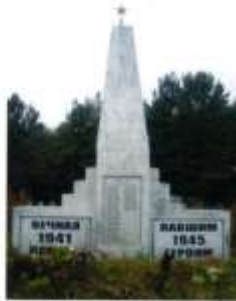
Памятник воинам, погибшим в годы Великой Отечественной войны, с. Нововольняцко