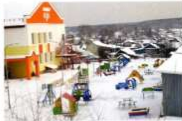
Новый детский сад