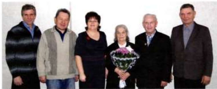
Главы Новосибирской территориальной администрации

ляла поселковый Совет в течение 15 лет с ноября 1963 года по июнь 1978 года. Настойчиво добивалась улучшения социально-бытовых условий жизни трудящихся. Избиралась депутатом Свердловского областного Совета трех созывов в 1971-1977 года, депутатом Пригородного районного Совета в 1965-1967 года.