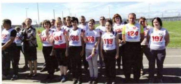
Слева направо ГТО

летика, спортивная семья, силовая гимнастика, мужской и женский волейбол и баскетбол, мини-футбол и лапта, гиревой спорт, армрестлинг, борьба на поясах, перетягивание каната. Первенство велось по двум группам: мало и крупно-населенные территориальные администрации округа. Не приняла участие лишь команда Синегорской территориальной администрации.