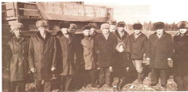
Руководители объединения «Тагиллес» и леспромхоза, 70-е годы

стали венчать символы СССР – серп и молот. С восточной стороны нанесена надпись «Азия», а с западной – «Европа». Памятник создан в 1967 году по проекту А. А. Шмидта и установлен рабочими леспромхоза «Синегорский» в честь 50-летия Великого Октября. От стелы ввиду уже виден поселок Синегорский. Здесь в 1948 году возник лагерь в составе Тагиллага. По воспоминаниям бывших узников, в лагере насчитывалось до 5000 человек, значительное число которых составляли жители Прибалтики, депортированные в конце войны. Силами заключенных была построена лесопилка и деревообрабатывающий комбинат.