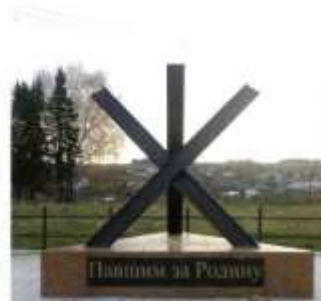
Мемориал «Пашим за Родину», в Горноуральском округе

Во времена Второй мировой войны жители станции Лая внесли свой посильный вклад в приближение Победы. Из блокадного Ленинграда эвакуировали завод № 576 по производству снарядов с оборудованием и специалистами. Люди жили в землянках