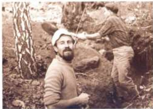
В геологоразведывательной партии