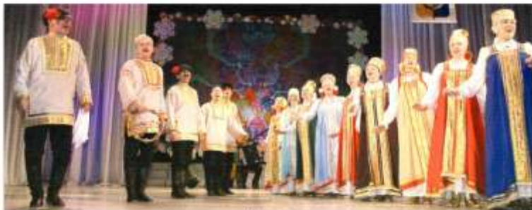
Народный коллектив - хор русской песни из села Покровское