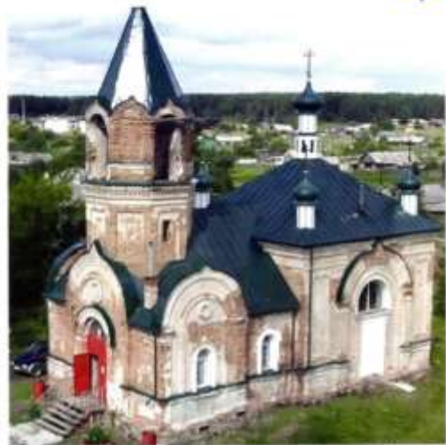
Церковь Рождества Пресвятой Богородицы в селе Башкарка