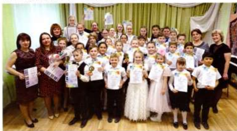
Коллекция преподавателей и обучающихся Чернышевской детской школы искусств

их подготовки к получению профессионального образования в области искусства в настоящее время реализуются дополнительные предпрофессиональные программы в области искусства. Сеть муниципальных бюджетных учреждений дополнительного образования, подведомственных Управлению, состоит из 4-х школ искусства. Все учреждения имеют лицензии на право ведения образовательной деятельности и на реализацию дополнительных предпрофессиональных общеобразовательных программ в области искусства. Учащиеся школ регулярно становятся лауреатами конкурсов и выставок различного уровня. На базе детских школ искусства округа ежегодно проходят популярные районные конкурсы детского творчества «Весенняя ахарея», «Музыкальный апрель», открытый конкурс живописных и графических плакатных работ «Оней очарование...». Существующая система художественно-эстетического образования детей востребована населением, широко развита и стабильно функционирует.