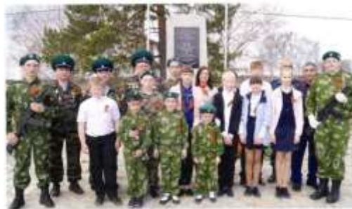
Покровская пограничная застава

В рамках патриотического воспитания территориальная администрация тесно сотрудничает с 42 Нижнетагильской ракетной дивизией, руководителем генерал-майор Эдуард Юрьевич СТАРОВОЙТЕНКО , Нижнетагильским ОМОН, ру-