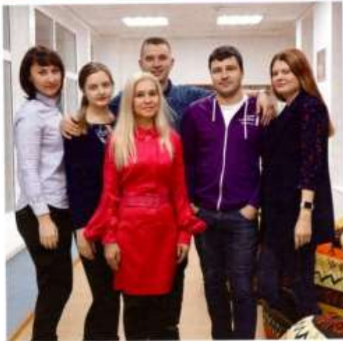
Коллектив Центра молодежной политики «ВМЕСТЕ»

Центр молодежной политики «ВМЕСТЕ» существует с октября 2018 года – это одна из самых «юных» организаций округа