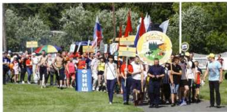
55-й районный спортивный фестиваль 2019 г. Парод