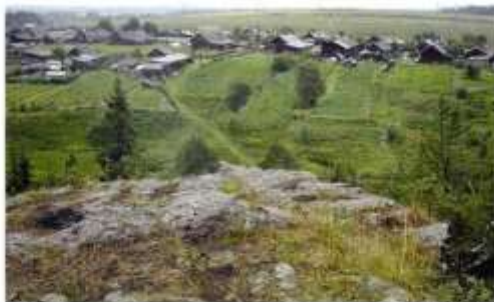
Село Малая Лая

блей на строительство танков и самолетов, за что получили благодарность от Сталина.