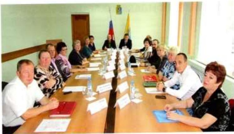
Первое заседание Общественной палаты Горноуральского городского округа