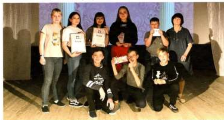
Образцовый театральный коллектив «Великолепный фантом» из поселка Новобисет