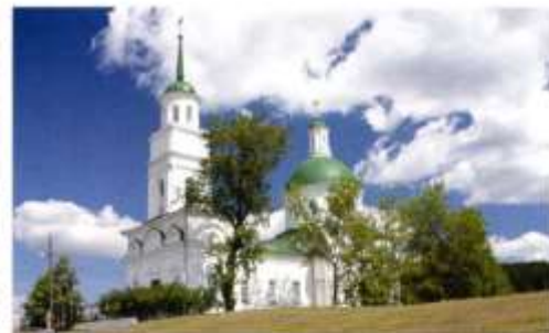
Церковь восточных Петра и Павла в Черноисточинске