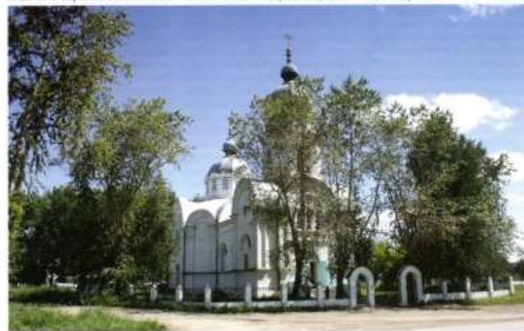
Церковь Марии Магdalины в с. Лав