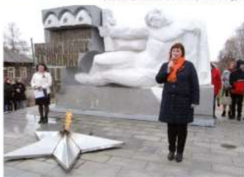
У памятника землякам, павшим в боях за Родину, 9 мая.

В РАЗНЫЕ ГОДЫ РУКОВОДИЛИ ПОСЕЛКОМ ВИСИМ ПРЕДСЕДАТЕЛИ ПОСЕЛКОВОГО СОВЕТА, А ПОЗЖЕ ГЛАВЫ АДМИНИСТРАЦИИ: