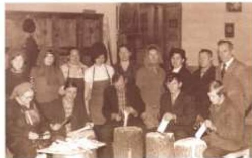
Бригада пожарников при комбинате

льшей в детском саду, очереди на поступление в сады нет.