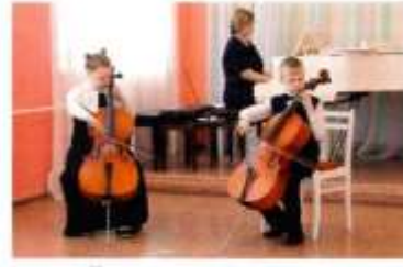
Юные музыканты детской школы искусств села Николю-Павловское