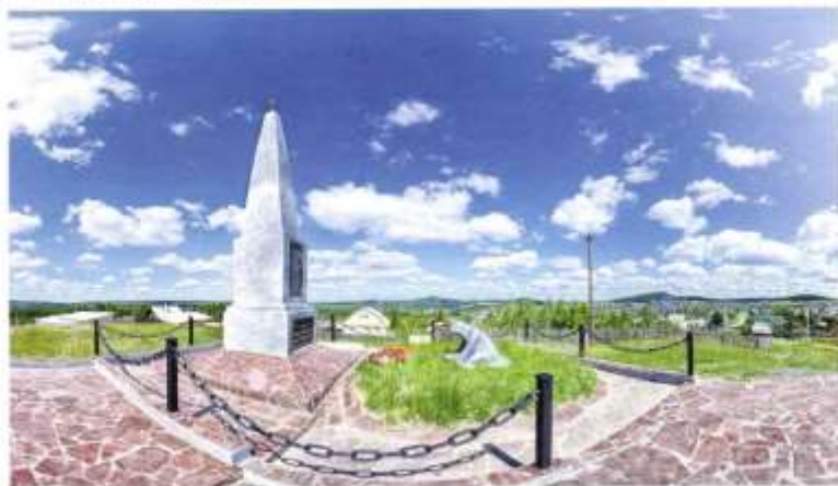
Памятник погибшим в годы Гражданской войны

делена горными речками Исток, Свистуха, Черная. К югу от поселка разлилась водная гладь Черноисточинского пруда.