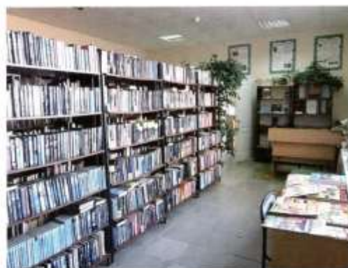
Петрокамская центральная районная библиотека

бойцам, погибшим в боях за Родину. Из Петрокамского на фронт ушло 400 человек, более 300 из них погибло. Все жители самоотверженно трудились в тяжелое военное, послевоенное время.