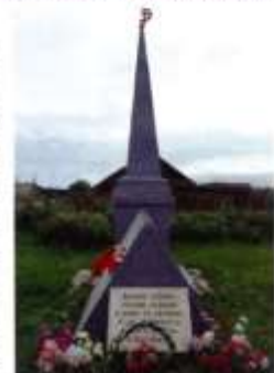
Памятник воинам, погибшим в годы Великой Отечественной войны, с. Башкарка

мы, новый мост через реку. В 1983 г. началось строительство блочных домов для рабочих совхоза. В 1992 г., после распада совхоза «Башкарский» на отдельные хозяйства, в с. Мокроусское было организовано КФС «Дружба», которое постепенно пришло в упадок.