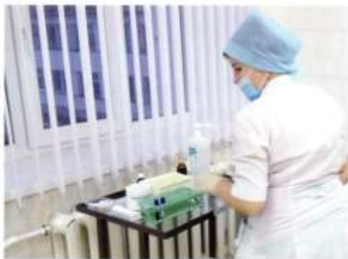
В Петрокамской больнице

Сегодняшняя жизнь невозможна без служб жилищно-коммунального хозяйства. На территории села работают четыре газовые котельные, причем две из них – современные блочные – построены в 2016 году. Петрокамские участки Горноуральской управляющей компании Невьянского ДРСУ подают