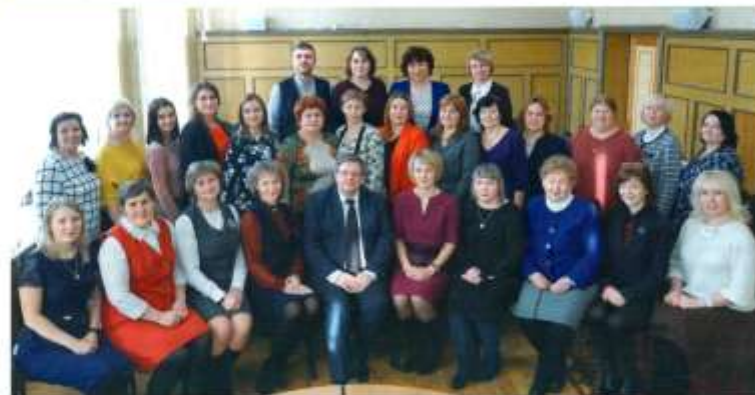
Совет руководителей образовательных организаций

На современном этапе развития общества ребенка нужно готовить к профессиональной мобильности, инициативности и умению творчески смотреть на окружающий мир. И наша задача – сделать всё, чтобы школьная жизнь была яркой и интересной, чтобы дети учились в комфортных, безопасных условиях, получали качественное образование.