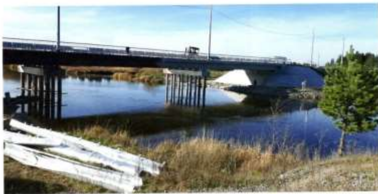
Мост в селе Дружино