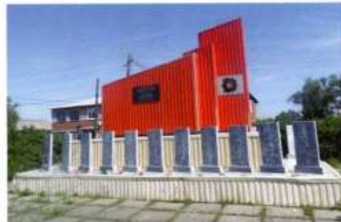
Памятник землякам, погибшим в годы Великой Отечественной войны

В апреле 1994 года население избрало меня главой Краснопольской администрации, а через 2 месяца итоги выборов отменили в связи с изменением в законодательстве и назначили главой Краснопольской администрации. При подготовке празднования 49-й годовщины Победы в Великой Отечественной войне я увидел, что из 6 населенных пунктов памятники погибшим только в двух: в с. Дрягуново и в д. Реши. В итоге мне пришлось принять решение о строительстве общего памятника погибшим в Великой Отечественной войне 1941-1945 годов в с. Краснополье. В данном вопросе район-