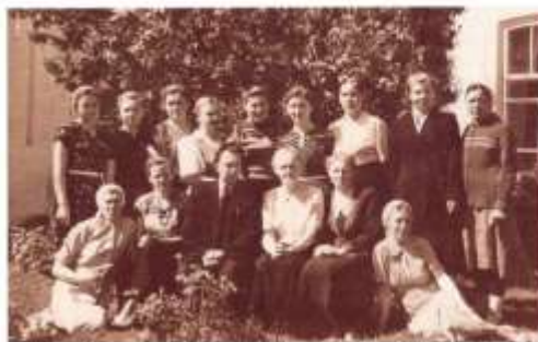
Коллектив больницы, 1960 г.

80-90-х годах выпускали мягкую мебель, кухонные гарнитуры.