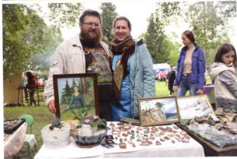
На фестивале «Самоцветная сторона»