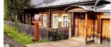
Музей Д. Н. Маминой-Сибиряка в пос. Васин

В конце 1980-х годов в районе производилась большая работа по созданию кооперативов, было зарегистрировано 22 кооператива (на начало 1990 года их насчитывалось 53),