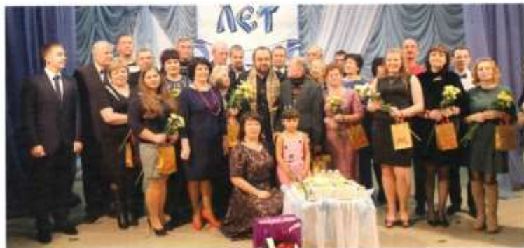
В 2015 году народный театр отметил свой 130-летний юбилей

улиц (или проще улочки). Создан ветеранов (в 2017 году ветеранской организации поселка исполнилось 50 лет!). Всё, что происходит у нас хорошего - во многом заслуга самих жителей.