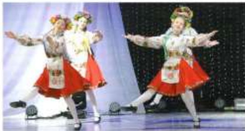
Образцовый хореографический коллектив «Родничок» из села Покровское

Пошла к людям, приглашала, разговаривала с жителями, учла все пожелания: нужен зарплатный руководитель хорового коллектива, танцевального. Что делать? Сначала на птицефабрику, к директору обратилась, объяснила, что нужны ставки руководителей. Сказал, что поможет. Поехала на Ваганьку в музыкальную школу приглашать бабачиста на работу, там наша специалистка и на танцевальный коллектив, и на аэрадный кружок. Жители всегда водили с удовольствием, дружные были и взрослые, и молодежь, и дети. Все делали вместе: субботники, ремонты,