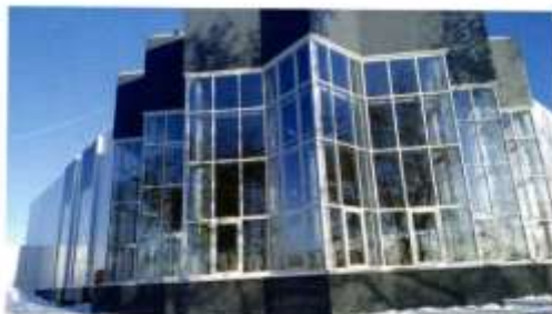
Современные здания Центра культуры села Петропавловское

лось земледелием. В деревне были 44 десятины приусадебных участков и 810 десятин пахотной земли. Занималось население Луговой подзаводскими работами, добычей золота и самоцветных камней на Валие и Тальме. В селении были церковная школа и одна торговая лавка. Работали три кузницы. Пожаром, случившимся в 1897 году, были уничтожены 53 усадьбы, сгорело 298 строений. По сведениям 1908 года, в Луговой были 142 двора, в них жили 625 человек.