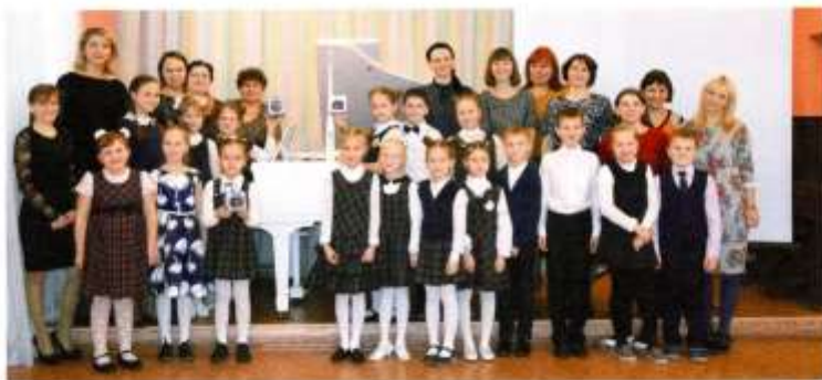
Коллектив преподавателей и обучающихся Николаево-Павловской детской школы искусств

«Я начала работать в библиотеке с 10 июня 1967 года. Библиотека находилась по адресу ул. Новая, 17. В этом же бараке находился поселковый совет, почта, сберкасса, бытовая комбинат. Когда в конце 1967 года было построено новое здание поселкового совета, все учреждения переехали туда, мы остались одни. Было решено отремонтировать дом под квартиры. Для библиотеки отремонтировали дом, в котором раньше находилось родительное отделение, у балкона. Туда мы переехали в марте 1968 года. Стеллажи были старые, деревянные. Было две комнаты: в одной хранились книги, другая - читальный зал. Отопление печное, здание очень холодное. Зимой работали в