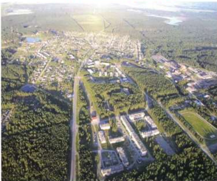
Панорама посёлка Новоасбест