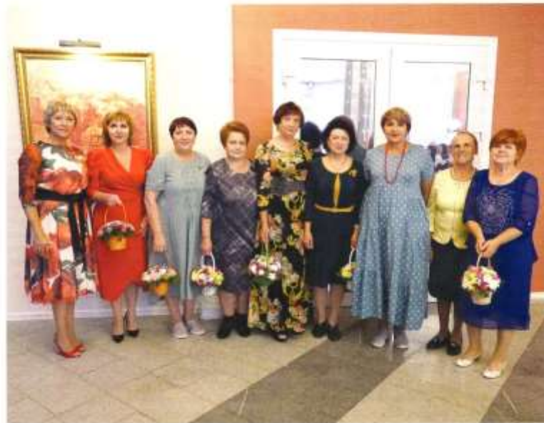
Ветераны финансового управления

В настоящее время численность работников в Финансовом управлении составляет 18 человек, из них 13 человек имеют стаж работы более 10 лет. Структура включает в себя 4 отдела: бюджетный, прогнозирования доходов и муниципального долга, казначейского исполнения бюджета, бухгалтерского учета и отчетности.