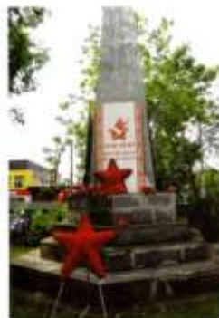
Памятник авиам, погибшим в годы Великой Отечественной войны, с Петрокамское