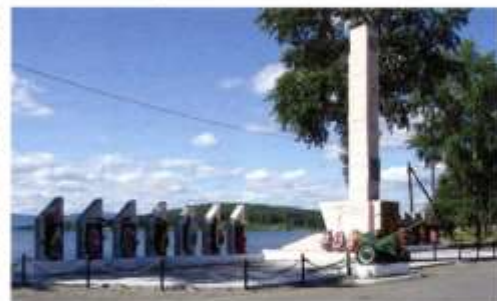
Обелиск воинам, погибшим в годы Великой Отечественной войны