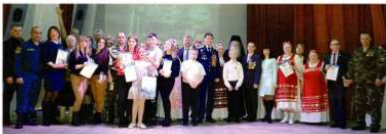
Фестиваль военно-патриотической песни памяти Ф. Х. Ахмаева «Честь имени»

родины, отсюда и пошло название – Покровское.