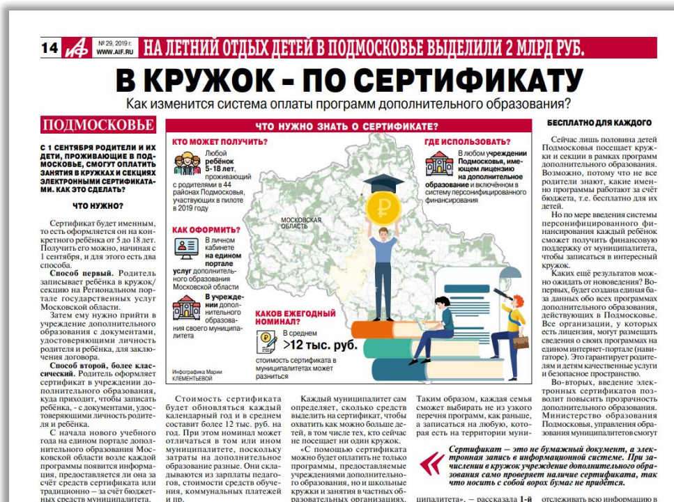
Рис 2. Пример публикации в СМИ

Также направить подготовленный текст учреждениям для размещения на сайтах учреждений.